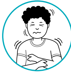
تبه، یخنی او لړزېدل