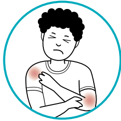
د عضلاتو او ګډ درد

ستاسو ماشوم د ځينو واکسينونو وروسته ممکن کوم جاني عوارض ولري.