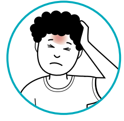
ستریا او سر درد