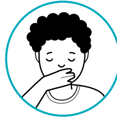
التهاب، کانګې او اسهال