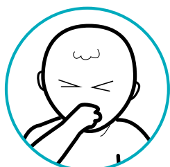
Náuseas, vómito y diarrea