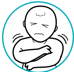
Fiebre y escalofríos