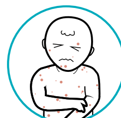
Después de las vacunas contra el sarampión, paperas y rubeola (MMR) y varicela: fiebre, erupciones cutáneas y otros efectos secundarios, 1 a 2 semanas después de la vacunación