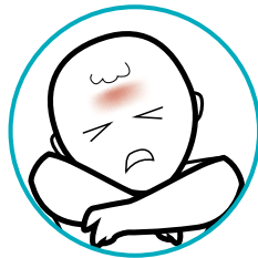
Cansancio y dolor de cabeza