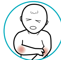
Dolores musculares y articulares