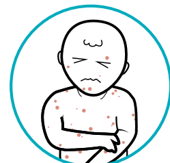
Sau khi chủng ngừa MMR và thủy đậu: sốt, da nổi đỏ, và có thể có các tác dụng phụ khác sau khi chủng khoảng 1-2 tuần