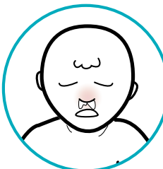
Sau khi chủng ngừa cúm (flu) bằng thuốc xịt mũi: nghẹt mũi và xổ mũi