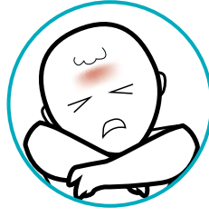
Mệt mỏi và nhức đầu