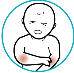
ألم في المفاصل والعضلات

الآثار الجانبية التي قد تظهر على طفلك بعد الحصول على بعض اللقاحات