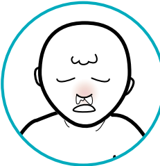
بعد أخذ رذاذ الأنف للقاح الإنفلونزا: احتقان الأنف وسيلان الأنف