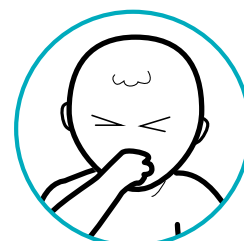
حالت تهوع، اسهال و استفراغ

بیشتر عوارض جانبی خفیف بوده و پس از یک تا دو روز از بین میروند