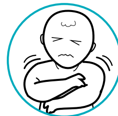
تب و لرز