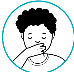
ዕግርግር፣ ተምላስን ውጽኣትን