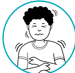
ረስኒ፣ ቊራ-ቊራ ምባልን ምንቅጥቃጥን/ ገብገብን