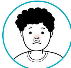
ድሕረ'ቲ ናብ ኣፍንጫ ዝንጸግ ክታቦት ኢንፍሉዌንዛ፣ ኣፍንጫዊ ማዕበስትን ጸረር ዝብል ኣፍንጫን