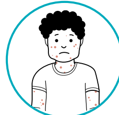
ድሕረ ክታቦት ንፍዮ፣ ጽግዕን ንፍዮ ጀርመንን (MMR) ፍሮማይን ረስኒ፣ ዕንፍፍርን ከምኡ'ውን ካልኣት ጎድናዊ ሳዕቤናትን ድሕረ ክታቦት ካብ 1-2 ሰሙናት ኣቢሉ ከጋጥም ይኽእል ኢዩ።