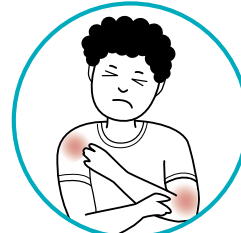
ቃንዛ ጭዋዳታትን መላግቦታትን