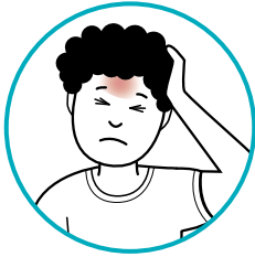
ድኻምን ሕማም ርእስን