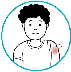
ቃንዛ፣ ምቕያሕን ሕብጥን ኣብ'ቲ ክታቦት ዝተዋህበሉ ቦታ ምስ ክታቦታት ኮቪድ-19፣ ክሳብ 7 መዓልቲ ብድሕረኡ ከጋጥም ይኽእል